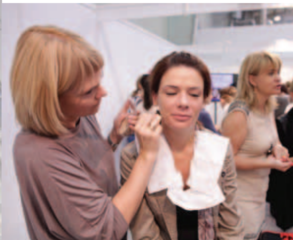
Warsztaty – makijaż w praktyce – Uczestniczki wykonywały perfekcyjne makijaże pod okiem międzynarodowego autorytetu – Vanessy Ventura Garcia